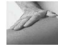
Puis massez la zone d'injection