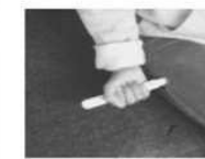
Masser légèrement le site d'injection