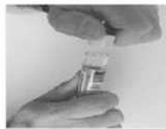
Enlever le bouchon jaune