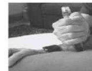
Appuyer fermement jusqu'à entendre un déclic en tenant la cuisse et maintenez appuyé pendant 10 sec.