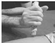
Placer l'extrémité orange du stylo sur la face extérieure de la cuisse