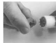
Retirer le bouchon noir protecteur