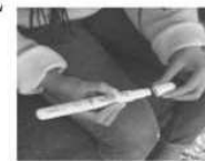
Enlever le capuchon protecteur de l'aiguille