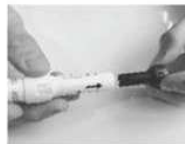
Enlever le capuchon noir protecteur de l'aiguille