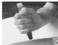
Placer l'extrémité noire du stylo sur la face extérieure de la cuisse