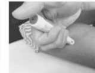
Appuyer fermement le stylo sur la face extérieure de la cuisse