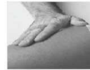
Puis massez la zone d'injection