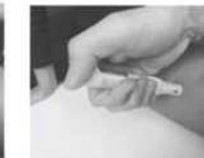
Puis appuyer sur le bouchon rouge de déclenchement et maintenez appuyé pendant 10 sec. Puis masser la zone d'injection