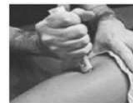
Appuyer fermement la pointe orange dans la cuisse jusqu'à entendre un déclic et maintenez appuyé pendant 10 sec.