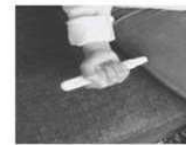
Placer et appuyer le stylo contre la face externe de la cuisse. Maintenir le stylo contre la cuisse pendant environ 5 secondes